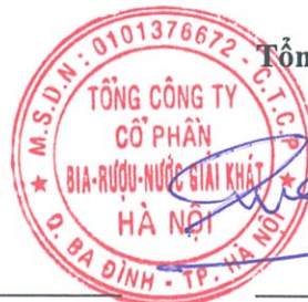
Ngô Quế Lâm