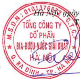
Ngô Quế Lâm